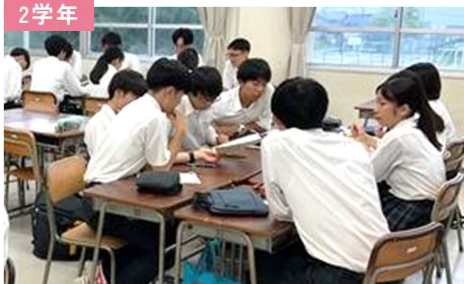
クラスの枠を超え、協働して探究活動を進める！