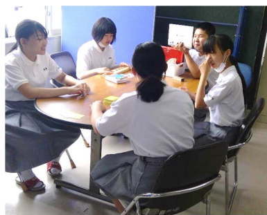
コミュニケーションスキルを高めるための ゲーム活動や他校とのオンライン交流会