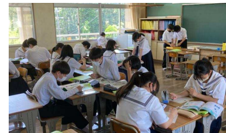
学ぶ場所や学習形態も生徒が決めます！