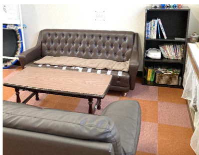
安心して学べる環境