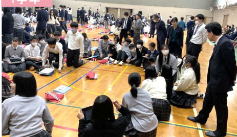
実際に地域に出て、課題を発見していく！