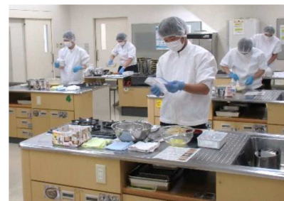
安心して学べる環境